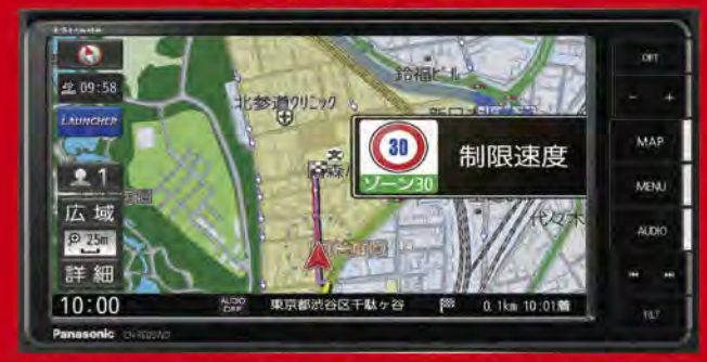
パナソニック製カーナビ「ストラダ」CN-RE05WD-5E